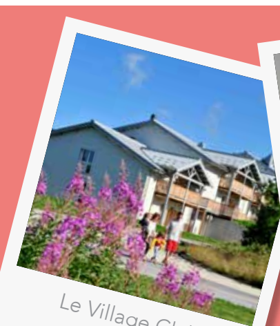
Le Village Club