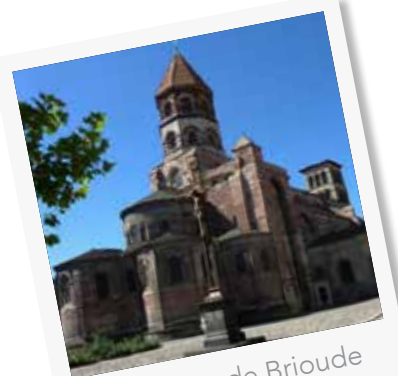
Basilique de Brioude