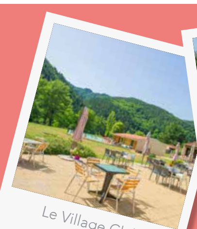
Le Village Club